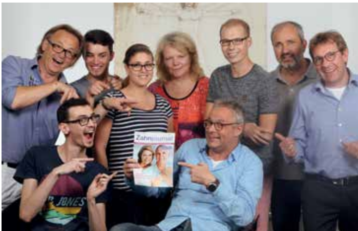
Mit Freude bei der Arbeit: das Redaktionsteam vom Zahnjournal.

Liebe Leserinnen und liebe Leser! Das Zahnjournal informiert Sie seit langem über wichtige Themen zur Zahngesundheit. Dabei liegt uns – den zahntechnischen Meisterlaboren Ihrer Region als Herausgeber – vor allem die verständliche, anschauliche und sachliche Aufbereitung der Informationen am Herzen.