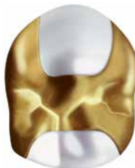
Wieder einsatzfähig! – Diese Kaufläche wurde mit einem Inlay aus Gold versorgt.

G ibt es eigentlich noch Goldzähne? – Früher blitzte es noch aus jedem zahn-technisch versorgten Mund hervor, in der modernen Zahntechnik scheinen die Vollkeramikkrone aus Zirkonoxid oder die Verbund-Metall-Keramik (VMK-Krone) die klassische Goldkrone verdrängt zu haben. Dies liegt natürlich auch an den überragenden ästhetischen Eigenschaften, denn Keramik lässt sich im bestehenden Gebiss sehr natürlich einpassen. Dennoch wird im Dentallabor für Zahnersatz nach wie vor Gold verwendet, denn das Material bringt einige Vorteile: Es ist stabil, lange haltbar, körperverträglich, gut im Guss- oder Fräsverfahren herzustellen und vielfältig zu verarbeiten. Während im hinteren Seitenzahnbereich Gold in seiner natürlichen Materialfarbe eingesetzt werden kann, entscheidet man sich im sichtbaren Bereich eher für eine zusätzliche keramische Verblendung. So passt sich die neue Krone aus Gold ebenfalls der natürlichen Zahnfarbe der umgebenden Zähne an.